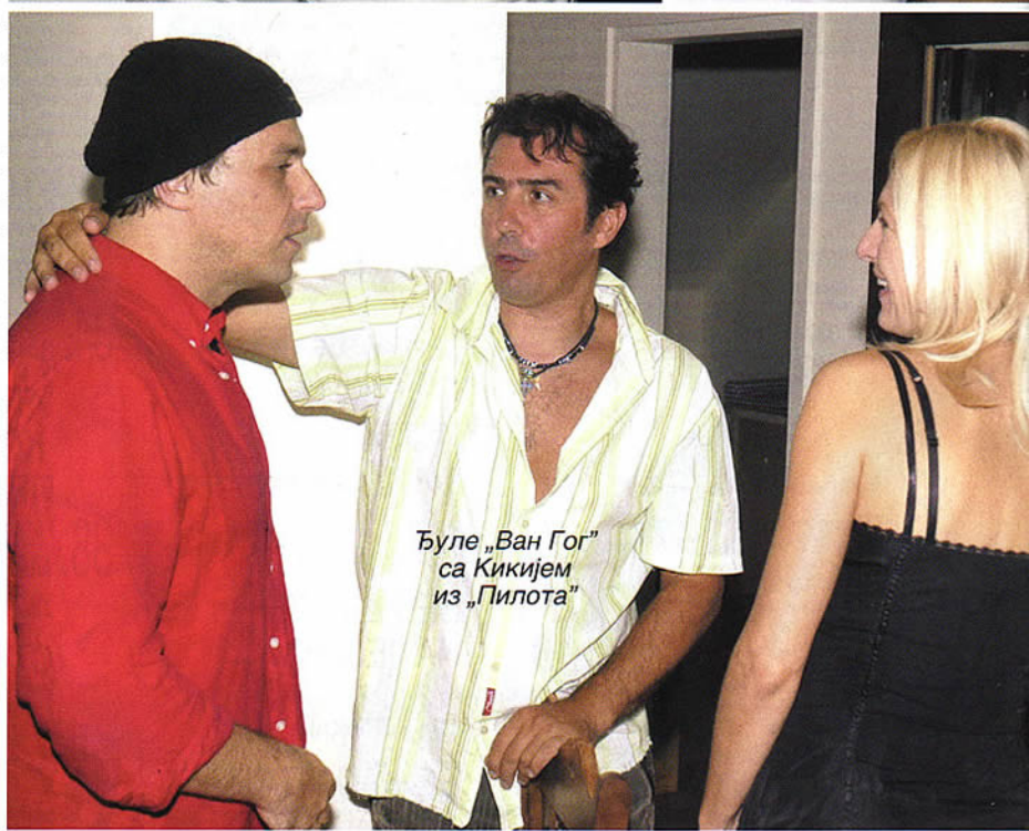
Буле „Ван Гог“ са Кикијем из „Пилота“