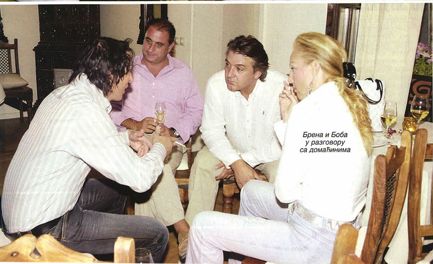
Брена и Боба у разговору са домаћинима